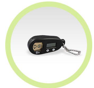
Testeur de piles

Conseils d'utilisation : Placer la pile sur la surface de métal côté positif (côté plat) de la pile sur le dessus. Pousser la pile vers le haut pour qu'elle vienne appuyer sur la plaquette de métal. Surveiller le petit écran noir : 1) si aucune ligne apparaît, cela signifie que la pile est morte et qu'elle doit être remplacée. 2) si les lignes montent plus haut que la moitié de l'écran cela signifie que la pile a encore suffisamment de courant pour fonctionner. 3) si les lignes demeurent en bas de la moitié de l'écran cela signifie que la pile n'est pas assez forte et qu'elle doit être remplacée.