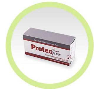
Protecpro en Capsules

Conseils d'utilisation : Tous les soirs, après avoir retiré la pile, placer l'aide auditive dans le gobelet contenant la capsule. Fermer le couvercle hermétiquement.