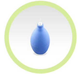
Poire à air

Conseils d'utilisation : Détaché le tube du coude (crochet) de la prothèse auditive et souffler de l'air à l'aide de la poire dans le tube. On peut au préalable faire tremper l'embout auriculaire dans de l'eau savonneuse et rincer.